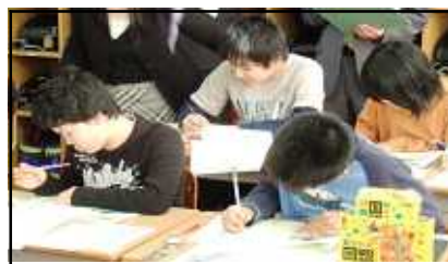
象潟ブロック授業交流会

2学期には多くの行事やコンクール、お客様の訪問がありました。なべっこ遠足、マラソン大会、授業研究会、浜っ子ジャンボ祭り、そして読書感想文や絵画、書写の各種コンクールなど。どの活動においても全校児童一人一人の力一杯のがんばりが見られた2学期でした。子どもたち124名全員に大きな拍手をおくりたいと思います。このように充実した2学期を過ごすことができましたのも保護者の皆様、地域の皆様のご協力のお陰と心より感謝を申し上げます。